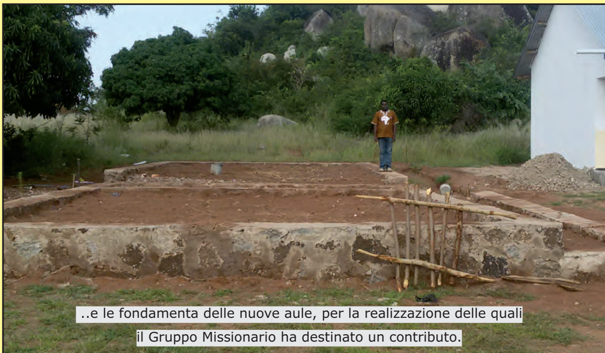
..e le fondamenta delle nuove aule, per la realizzazione delle quali il Gruppo Missionario ha destinato un contributo.

Carissimi amici del G.M.C.C., Sono molto lieto di dare la conferma che abbiamo