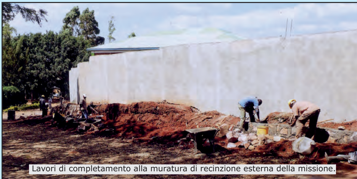
Lavori di completamento alla muratura di recinzione esterna della missione.

Noi Consorelle stiamo tutte bene nonostante che la vita é diventata molto cara e sempre più dura. I prezzi sono aumentati tre o quattro volte negli ultimi tempi. Il mais seminato non e' ancora pronto, quello da mangiare non si trova neanche per comprare. Lo nascondono perchè i prezzi salgono.