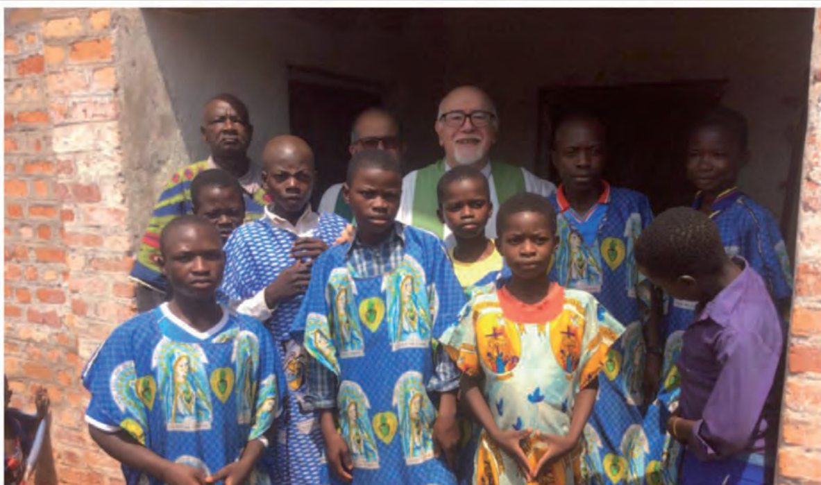
Grazie dal Congo