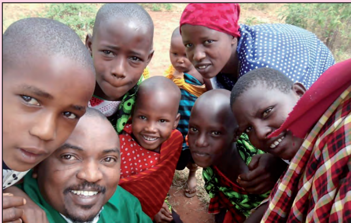
Un selfie di Padre Lawrence con alcuni ragazzi della missione.