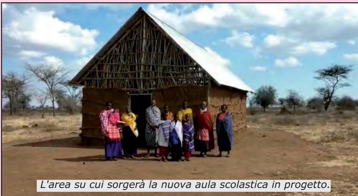
L'area su cui sorgerà la nuova aula scolastica in progetto.

I grandi benefici che sono conseguiti dalla realizzazione di questa scuola, sia ai piccoli che ai grandi, si sono diffusi nei vari villaggi in piena savana e che si trovano nella stessa situazione. Ai bambini piccoli è impossibile recarsi a scuola dell'infanzia sia per la lontananza che per i rischi che incontrerebbero per la presenza di animali pericolosi. Gli abitanti del villaggio di KatiKati si sono impegnati ad acquistare il terreno mentre il nostro gruppo li sosterrà nella costruzione impegnandosi con un contributo di 12.000 euro.