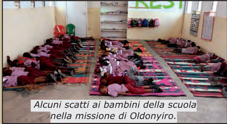
Alcuni scatti ai bambini della scuola nella missione di Oldonyiro.